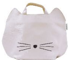
【クールグレー M】 品番: 21P 44431 JAN: 44431 6