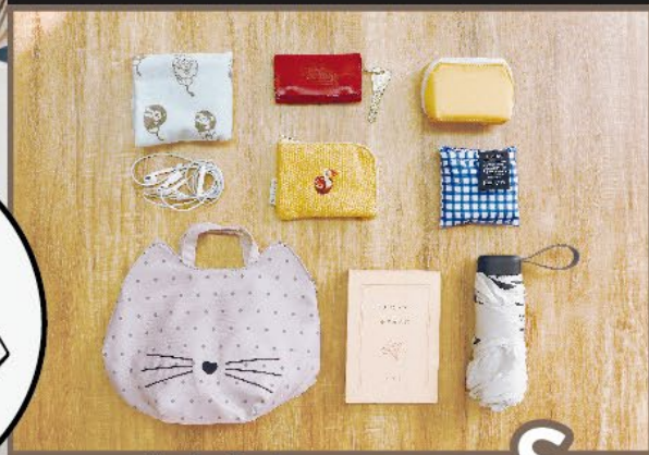
休日のコーデカケに丁度良い! S size