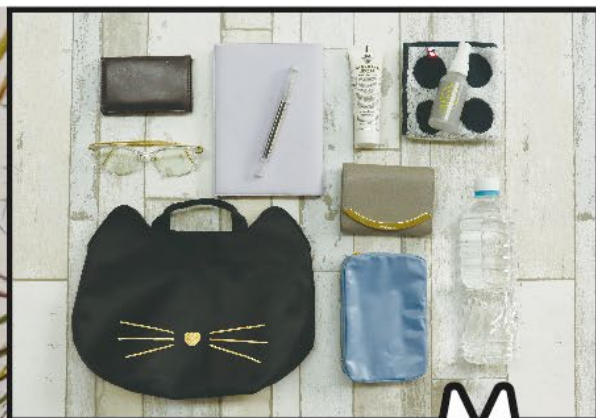
ランチタイムに持ち出し便利な M size