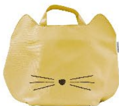
【ナチュラルベージュ M】 品番: 21P 44432 JAN: 44432 3