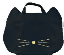
【ランブブラック M】 品番: 21P 44430 JAN: 44430 9

サイズ: Mサイズ 約W310×H230×D110mm 重さ: 約80g / Sサイズ 約W250×H200×D110mm 重さ: 約55g 素材: ポリエステル 入り数: 48pcs入 (出荷単位6pcs)