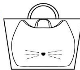
バッグインバッグ